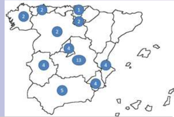
Entrevistas de captación por sectores

Finalmente se hicieron un total de 43 entrevistas en diferentes regiones y con un amplio abanico de sectores de actividad.